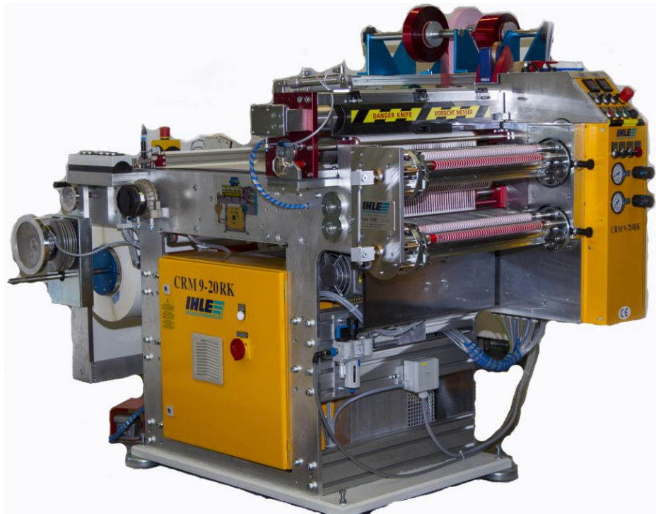
CRM 9 Baureihe

kurze, schmale Klebebänder, Korrekturbänder und ähnliche Produkte